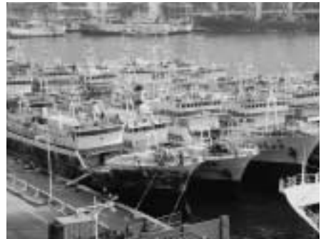
係船中の減船対象船

のみ、海洋大学に寄付）この結果、台湾の遠洋マグロ延縄漁船は、421隻に減少する。（日本への台湾漁船のマグロの供給量は、今