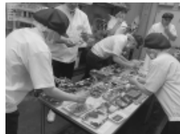
調理実習で作ったマグロ料理を試食する受講生

相原専務は「家庭での食材の主な購入者である主婦が「欲しい」と思う情報を提供できる女性パート職員さんまで今回初めて受講してくれ、冷凍マグロ消費拡大の強い味方になってくれると期待する。100年以上、マグロ廻船問屋、冷凍マグロ流通業に携わり、同漁業存続の支援こそが使命と考える当社としては、販売の最前線で働く『まぐろコンシェルジュ』に大きな期待を寄せている」と話す。