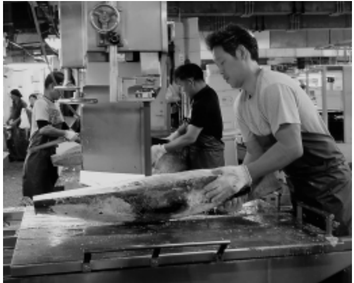
冷凍マグロの個体ごとの特徴を見極め、複数片に裁割(裁断、分割)する技術に優れる三崎の加工業

でなく、血合い肉を削ることで規格外になっていた部位も価値が上がり、これが生産者や加工業者に還元されることで、水産業の経営改善にも寄与できます。